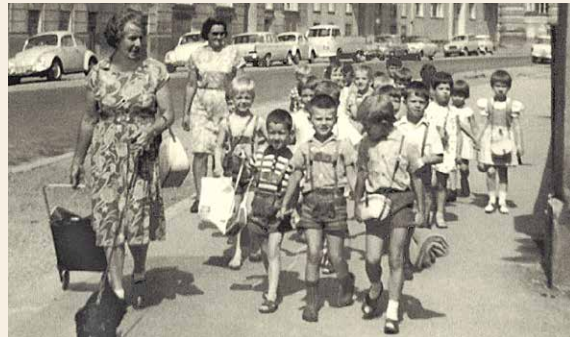
Wiener Kindergartengruppe in der Nachkriegszeit