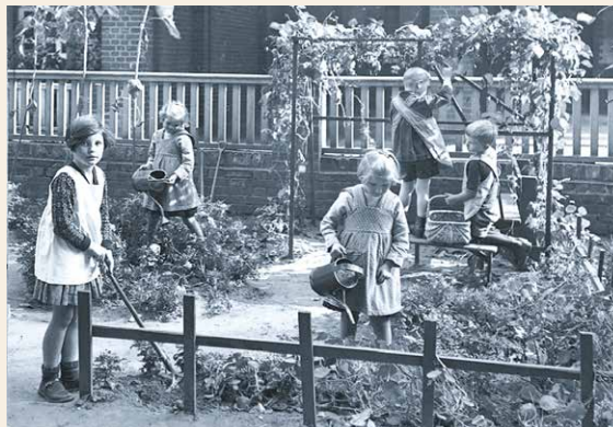
In den 1930er-Jahren gab es noch weitgehend unbeschwerte Kindergarten­ erlebnisse.

Nicht nur pädagogische Themen wurden behandelt, sondern immer spiegelt sich in „Für unsere Kinder“ auch die wirtschaftliche und gesellschaftspolitische Situation wider. Publikationen stehen in politischen