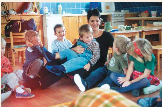
Es entsteht eine Pädagogik auf Augenhöhe der Kinder.