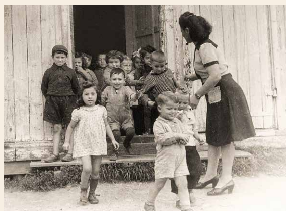
Dem Weltkrieg folgten Not und Elend – auch in Lagern.